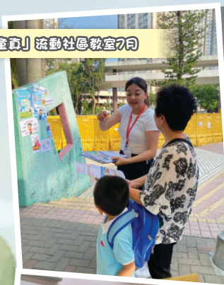
「守護童真」流動社區教室(2月)