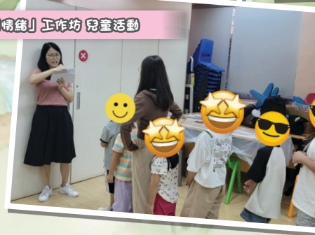
「童學情緒」工作坊 兒童活動