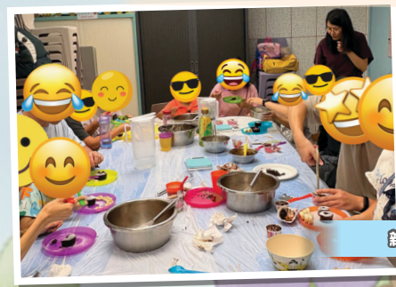
親子下廚樂·心太軟製作