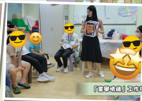
「童學情緒」工作坊 兒童活動